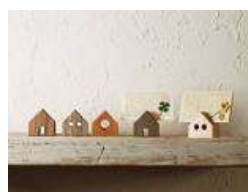
on the desk カード立て 三角屋根のカード立て