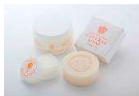
BABY&MOTHER 天然馬油のスキンケア