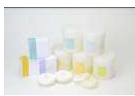
スウィーツキンケア シュクレ 甘いお砂糖のスキンケア