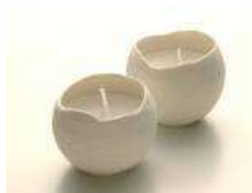
スノーボールキャンドル 雪玉の形をしたキャンドル