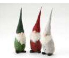
森の精 手稲の森に住むニンゲル