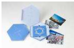
サポロ・ビジュアル・シフォン 映像と音楽で札幌散歩