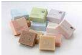
Savon de Siesta 道産素材の手作り石鹸