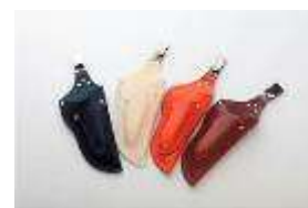
Zion フォーリストケース 牛皮革製の花鋏ケース