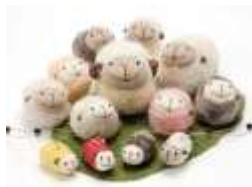
ふわふわラムキン 道産羊毛のマスコット