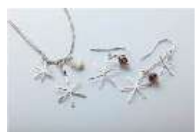
クリスマス / パール 繊細なシルバークラフトと天然石