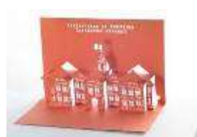
3D ART 赤レンガ ポップアップカード