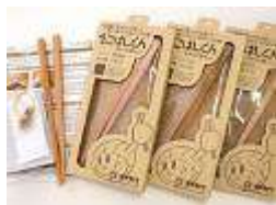
えこはしくん 自分でつくろうマイ箸キット