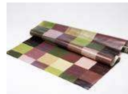
さくらシート 自然配色レジャーシート