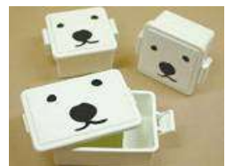
GEL-COO ま 保冷剤つきランチボックス