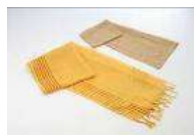
たまねぎ染めシリーズ たまねぎで染めました