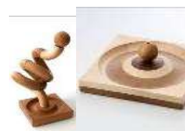
tukkun シリーズ 磁石と道産材のマグネット