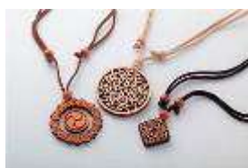
AINU デザインペンダント アイヌ紋様の木製ペンダント