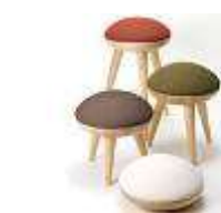
KINOCCO (木のっ子) 道産センノキのスツール