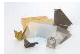
北の動物おりがみ 北の動物が楽しく折れます