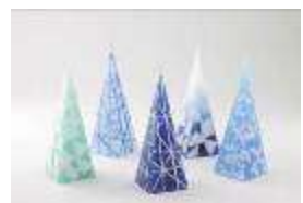
フロストピラー 札幌の冬をイメージ