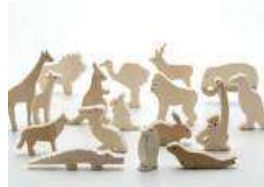
木の ZOO シリーズ 円山動物園の動物たち