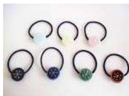
スノーflakeヘアゴム 女性に人気のヘアアクセサリ