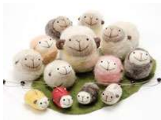
ラムキン 道産羊毛のマスコット