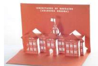
3D ART 赤レンガ ポップアップカード