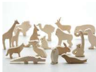
木のZOO° 円山動物園の動物達