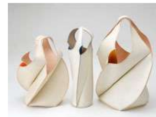
EZO bag エゾシカ革のバッグ