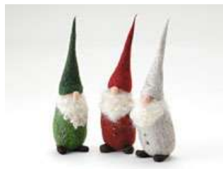
森の精 手稲の森に住むニングル