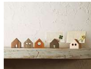
on the desk カード立て 三角屋根7つのカード立て