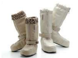
ちゅーりっぷの靴 歩行が困難な方の足を保護