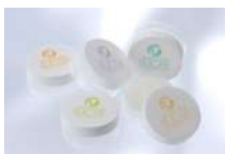
シュクレ 北海道産ビートのスキンケア