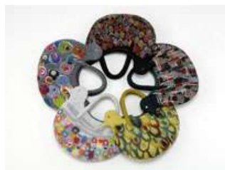
トリ型フェルトバッグ 札幌の冬景色に合うバッグ