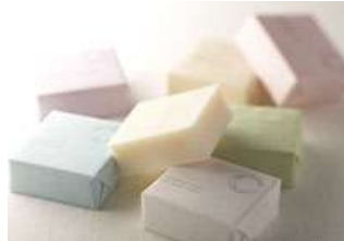
Savon de Siesta 道産素材の手作り石鹸