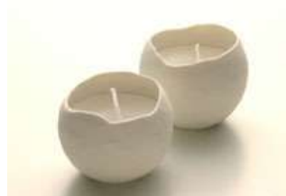
スノーボールキャンドル 雪玉の形をしたキャンドル