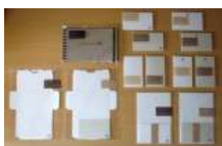
とうきびペーパー紙小物 とうきびの皮から生まれた