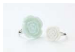
バラリング 雪と氷の花飾り