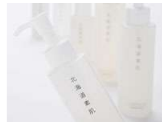
北海道素肌 (R) シリーズ サケから抽出した保湿成分