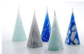
フロストピラー 札幌の冬をイメージ