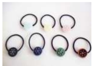
スノーflake ヘアゴム 女性に人気のヘアアクセサリー