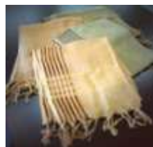
たまねぎ染めストール たまねぎで染めました