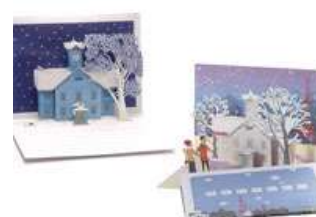
時計台 立体カード ポップアップカード