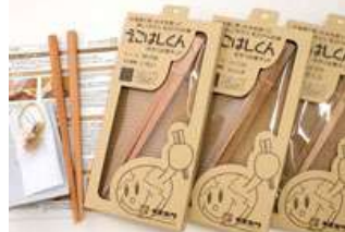
えこはしくん 自分でつくろうマイ箸キット