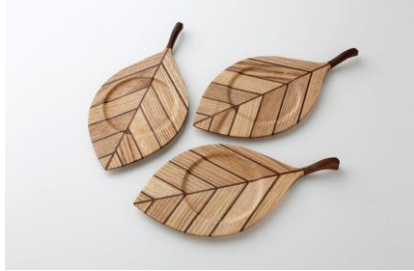
<新規認証製品>木の葉コースター