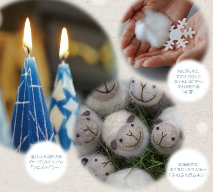
凛とした札幌の冬をイメージしたキャンドル「フロストピラー」

また、今年1月に新たに仲間入りした新規認証製品も登場しますので、ぜひご覧ください。